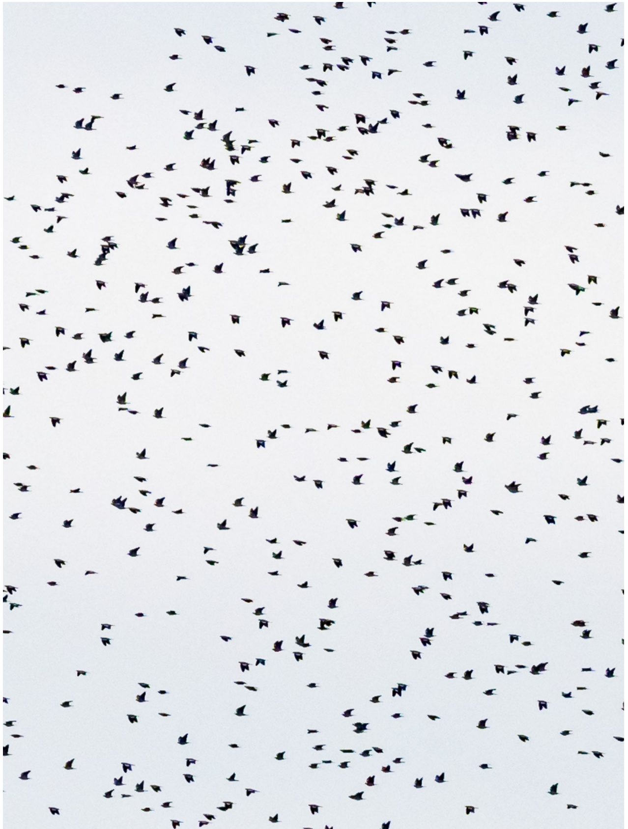
Ringeltauben um 16.17 Uhr.