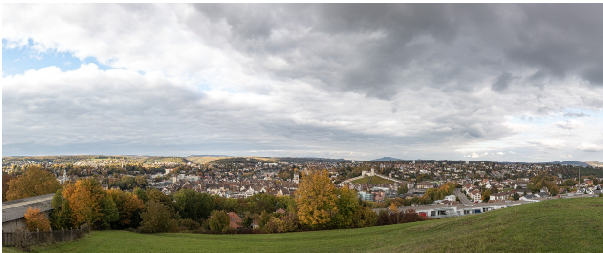
Panoramaaufnahme vom Beobachtungsort «Allenwinden» Flurlingen über die Stadt Schaffhausen Richtung Norden. Links bis zur Bildmitte der «Randen» (900m), über dem Munot SH (rechts des Bildzentrums) am Horizont der «Hohenstoffeln» 831m, Distanz 14,5 km.