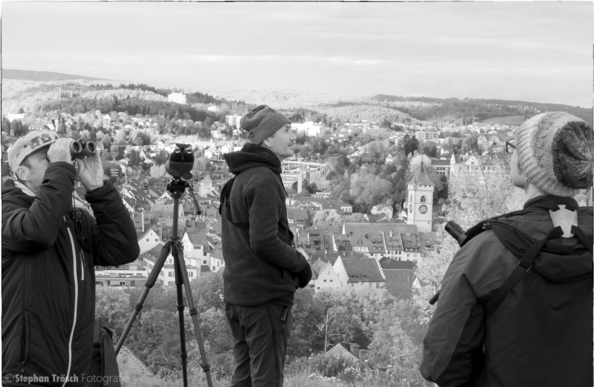
Stimmungsbilder vom Beobachtungsplatz.